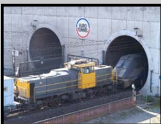
Lundi 1 er octobre, 16 h. Une locomotive diesel Krupp commence à extraire la Navette endommagée du Tunnel Sud.

Dès le feu vert des autorités judiciaires obtenu, Eurotunnel s'est employé à extraire la Navette endommagée du Tunnel Nord, de manière à rendre au plus vite l'intervalle 6 accessible aux travaux. Le 1 er octobre, un premier tiers du convoi a été tracté d'un seul tenant et sur ses roues : chacun a pu constater que la locomotive et le wagon club-car, dans lequel voyagent les chauffeurs routiers, étaient intacts. Ce qui témoigne de la priorité absolue donnée par Eurotunnel à la protection des personnes. Tous les éléments de la Navette, comme l'intervalle 6 à ce stade, restent à la disposition de la police judiciaire et du magistrat instructeur pour les besoins de l'enquête.