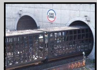
Les premiers camions détruits par le feu, origine possible du sinistre. Les wagons porteurs ne sont pas déformés.

Pour contacter le Centre Relations Actionnaires