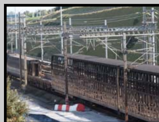
En dehors de dépôts de suie, le wagon-chargeur et les trois premiers wagons-porteurs apparaissent sans dégât.