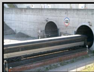
Le wagon-club car, dans lequel voyagent les chauffeurs routiers, est intact : priorité à la sécurité des personnes !